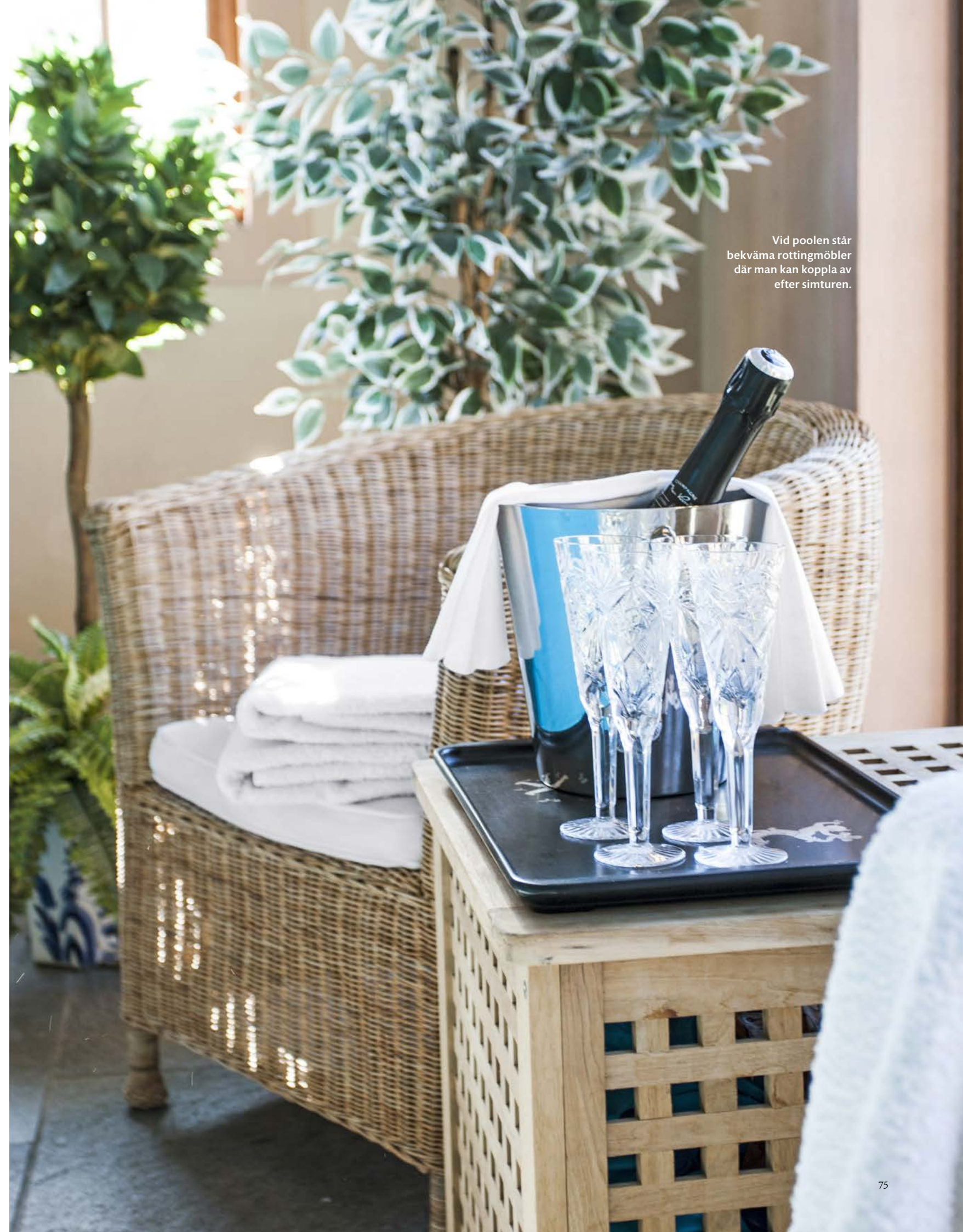
Vid poolen står bekväma rottingmöbler där man kan koppla av efter simturen.