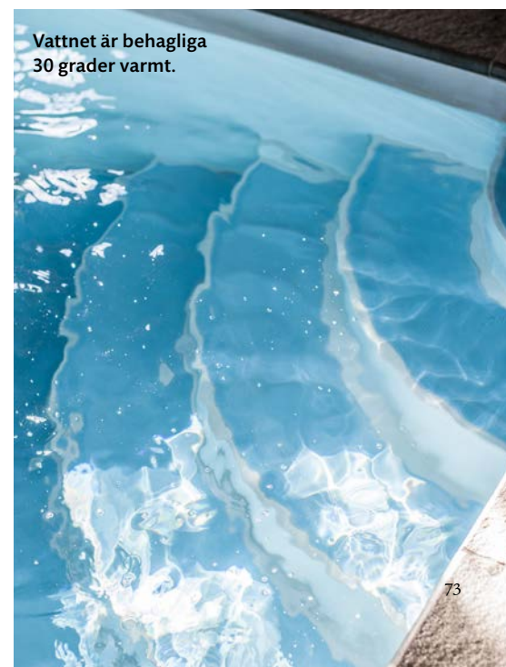
Vattnet är behagliga 30 grader varmt.

Poolflygeln har blivit ett ljust och luftigt rum med stora fönster. Tre dubbla franska >