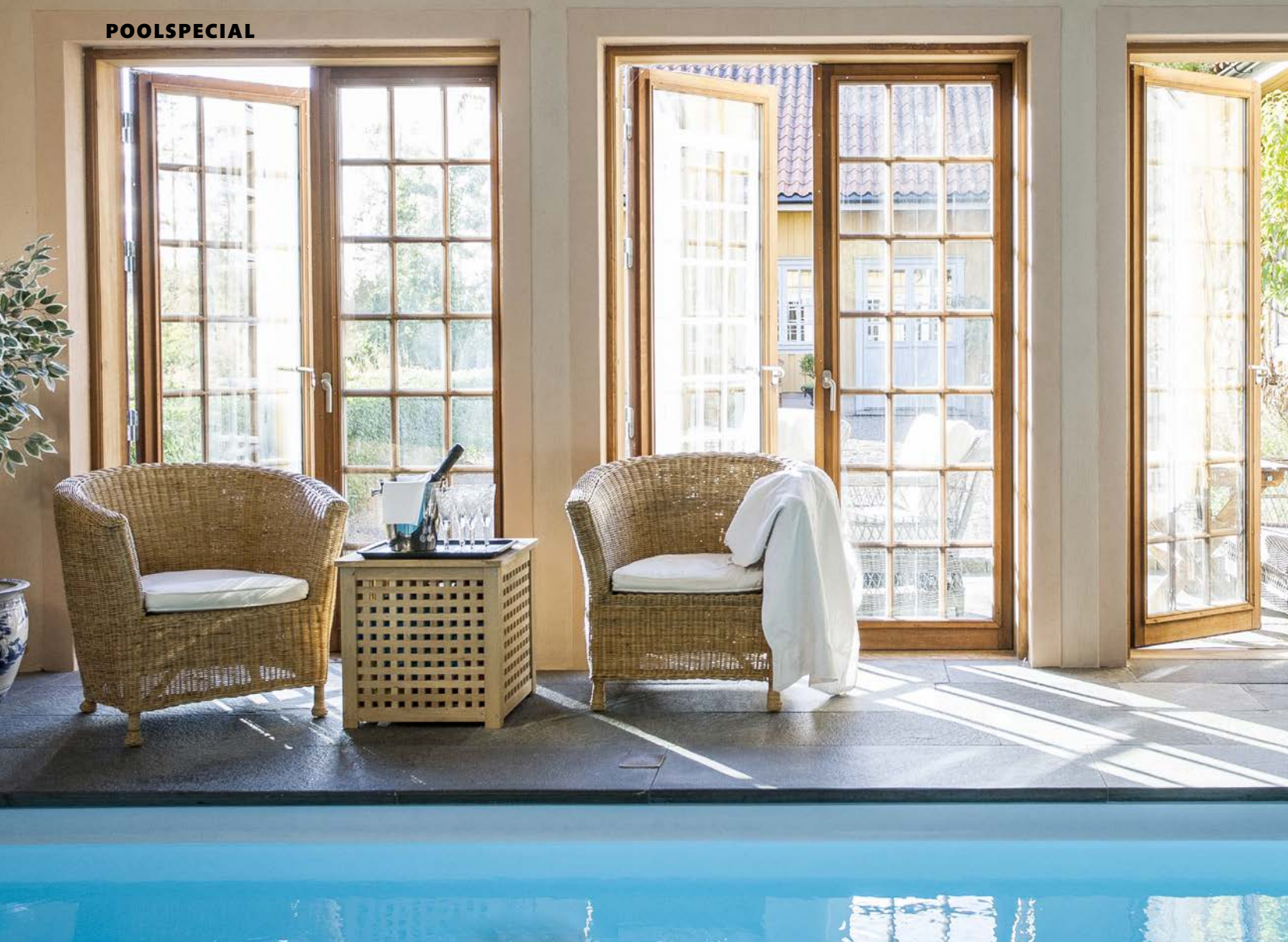
Sköna sommardagar öppnas de generösa franska dörrarna mot gården.