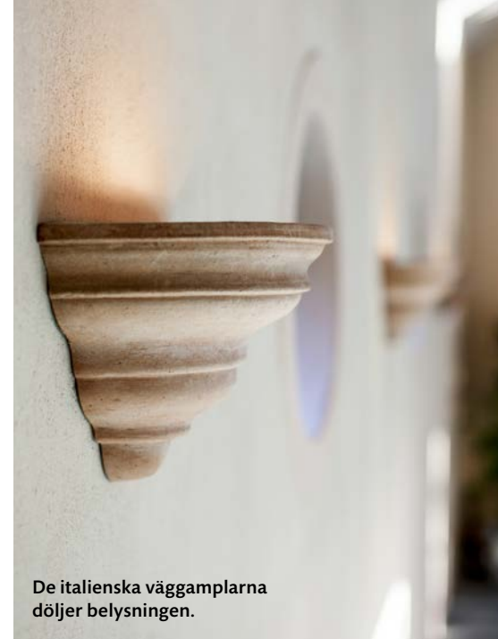
De italienska väggamplarna döljer belysningen.

Med tanke på det svenska klimatet valde familjen att bygga en inomhuspool.