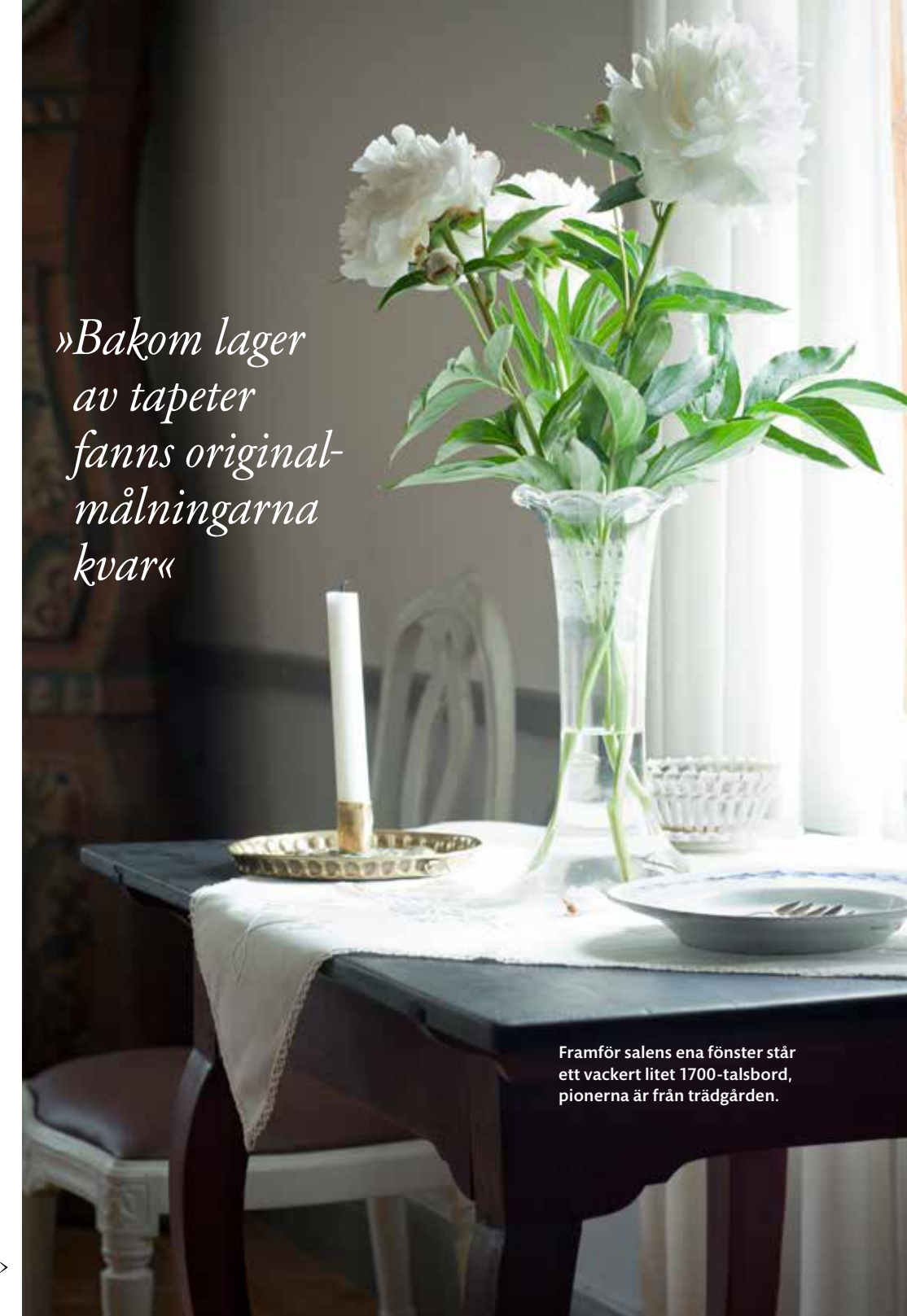
Framför salens ena fönster står ett vackert litet 1700-talsbord, pionerna är från trädgården.

»Bakom lager av tapeter fanns originalmålningarna kvar«