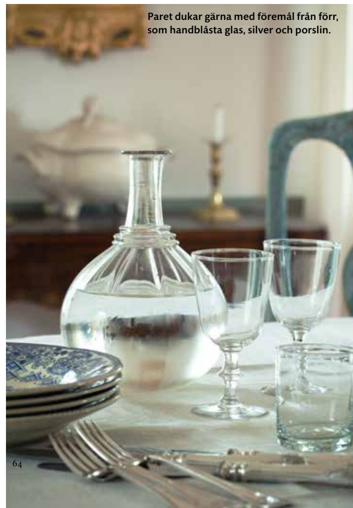
Paret dukar gärna med föremål från förr, som handblåsta glas, silver och porslin.