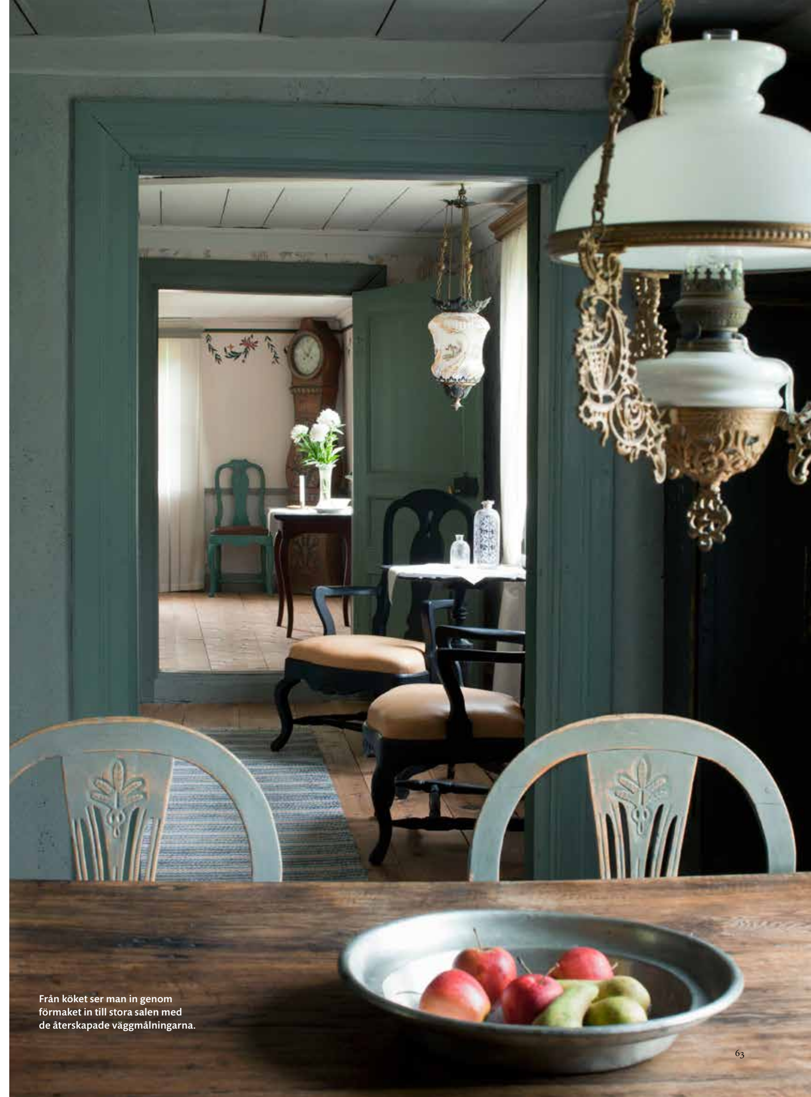
Från köket ser man in genom förmaket in till stora salen med de återskapade väggmålningarna.