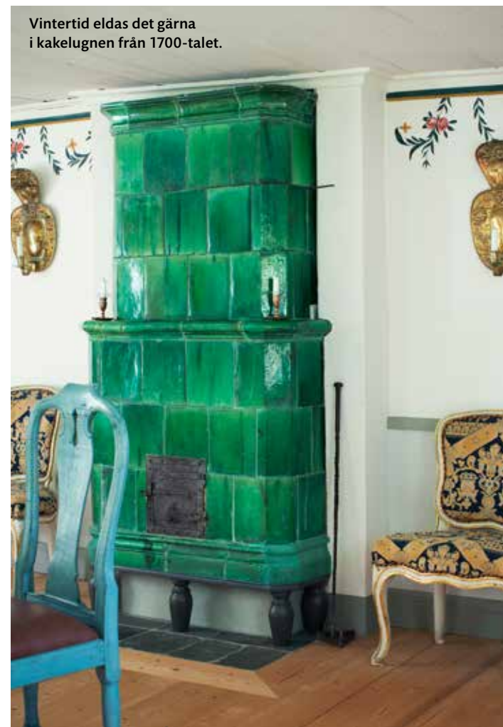
Vintertid eldas det gärna i kakelugnen från 1700-talet.