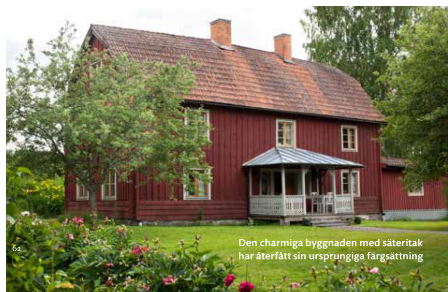
Den charmiga byggnaden med säteritak har återfått sin ursprungliga färgsättning

Ju mer vi går runt i huset desto mer inser >