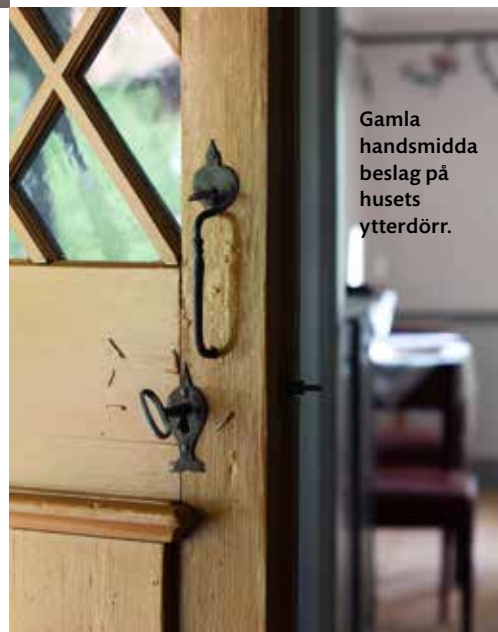
Gamla handsmidda beslag på husets ytterdörr.