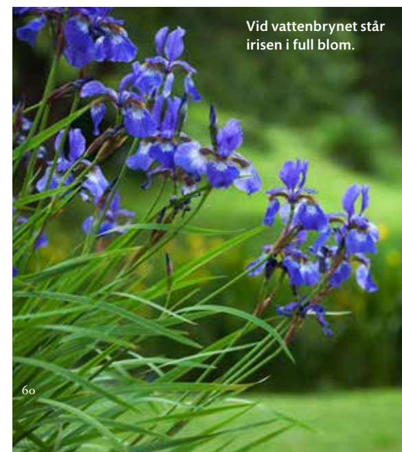
Vid vattenbrynet står irisen i full blom.

Som en pärla ligger den återställda garvaregården bland lummiga fruktträd och välkrattade grusgångar.