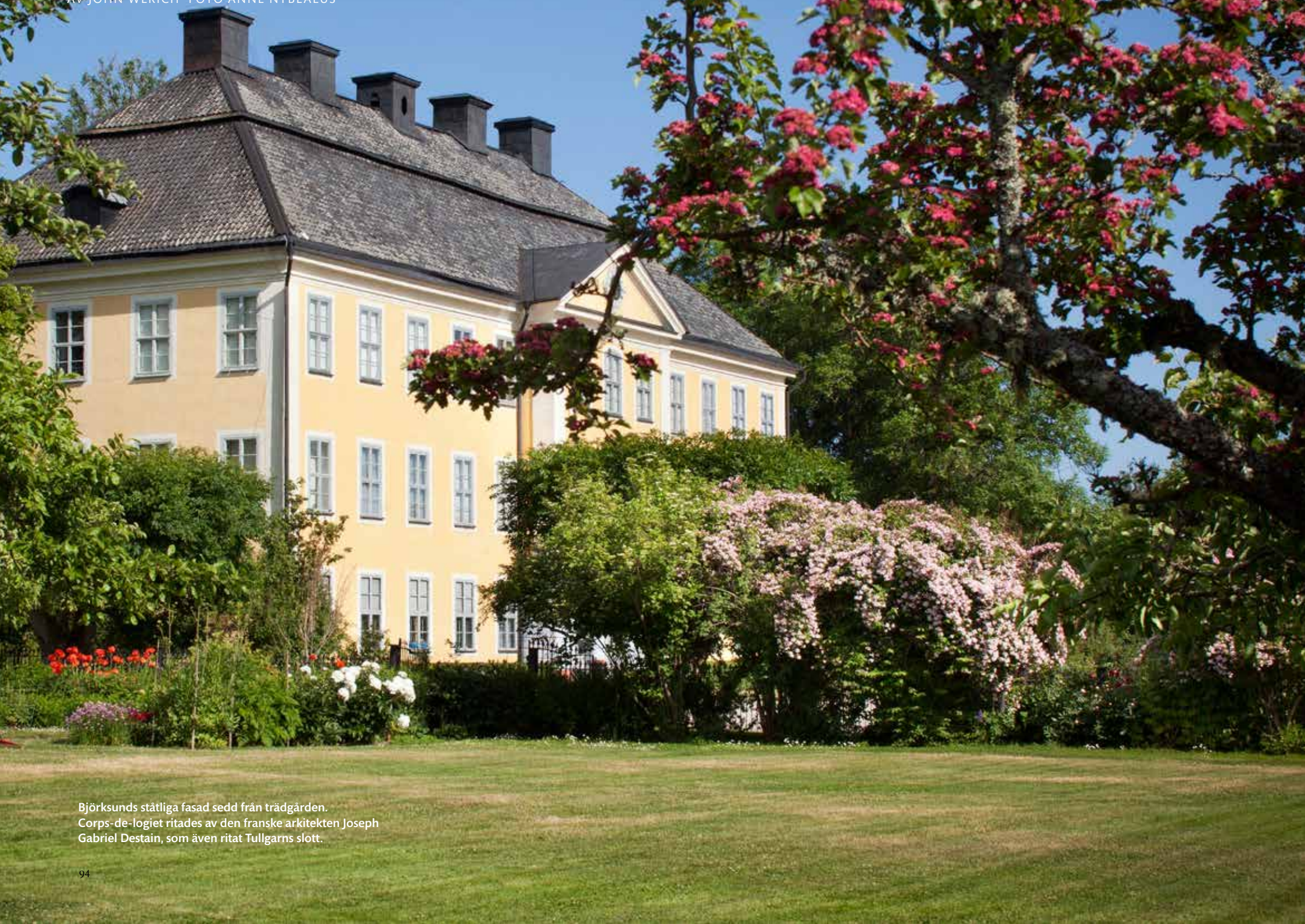
Björksunds ståtliga fasad sedd från trädgården. Corps-de-logiet ritades av den franske arkitekten Joseph Gabriel Destain, som även ritat Tullgarns slott.