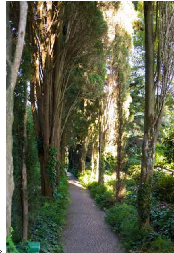
Cypresserna i den stora allén är nu över 100 år och reser sig mäktigt över trädgården.

De närmaste åren hängav sig Munthe åt att renovera och bygga ut villan och anlägga den vackra trädgård vi än i dag kan besöka. Vid övertagandet av villan var trädgården en terrasserad vingård. Att marken redan var >