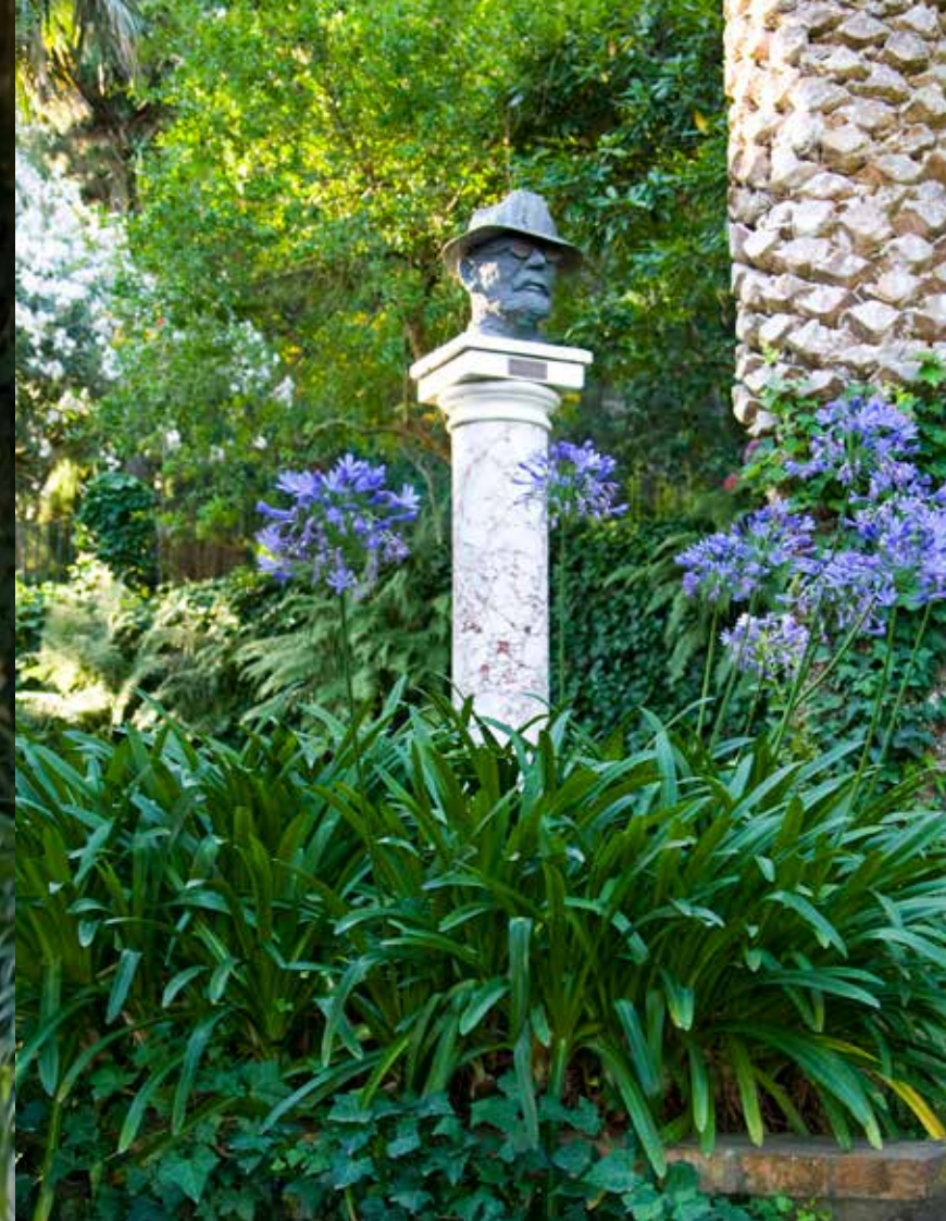
Ovan t v: En byst av Axel Munthe omgärdad av Afrikas liljor. Ovan t h: På innergården står en kopia av renässansmästaren Andrea del Verrocchios Putti med delfin , originalfontänen står i Palazzo Vecchio i Florens.