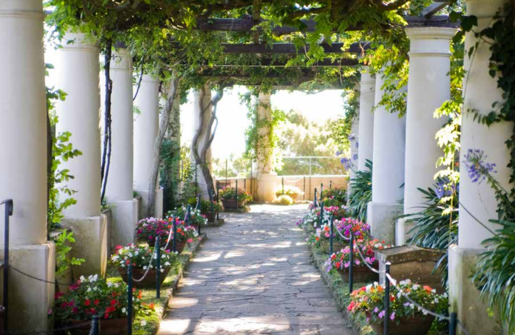
Längs hela pergolan växer agapanthus, Afrikas lilja, och flitiga lisor i krukor.