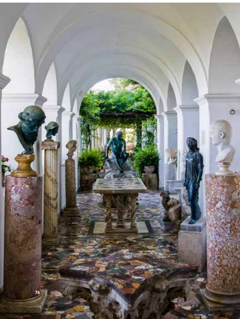
Ovan: Längst bort i trädgården gör pergolan en elegant sväng och bjuder på en makalös utsikt över Neapelbukten och Capris stad. Nedan till vänster: Närmast villan finns en loggia med Munthes samling av antika skulpturer och moderna kopior. Nedan till höger: En romersk sarkofag fungerar som en liten damm där det växer papyrus.

Marktäckaren Dichondra repens , njurvinda, under en kamelia.