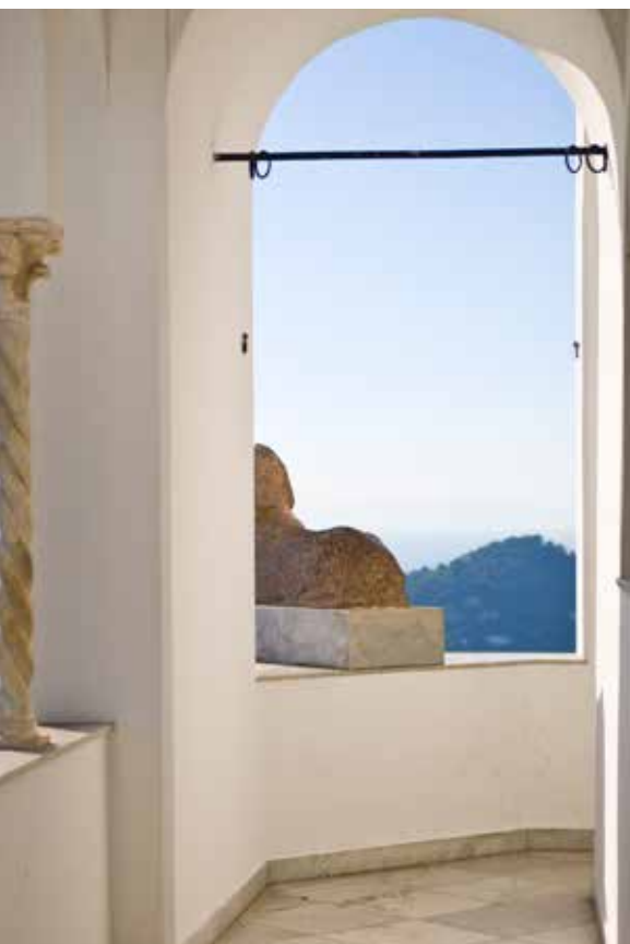
Bakom kapellet, längst bort i trädgården, står Munthes sfinxstaty och blickar ut över bukten nedanför.