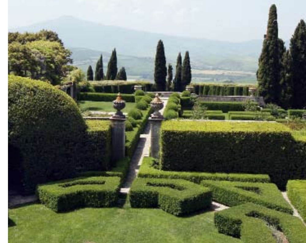
Från trädgården har man en betagande utsikt över Val d'Orciadalen.

På försommaren blommar trädgården. Här en gnistrande vit jättevallmo.