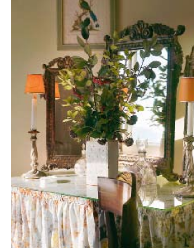
Huses rum dekoreras sommartid med blommor från den egna plockträdgården.

VIA SMALA GRUSVÄGAR som slingrar sig mellan kullarna i Orciadalen, alldeles mellan Pienza och det välkända vinddistriktet Montepulciano, kommer man till La Foce – en gång i tiden författarinnan Iris Origos herrgård.