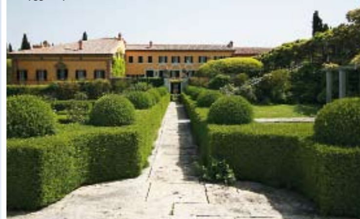
La Foces vänstra del uppfördes under 1400-talet, tillbyggnaden byggdes på 1900-talet.

TEXT JOHN WERICH