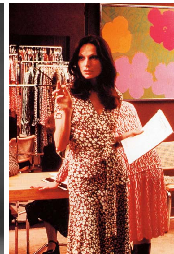
Bild till vänster: Nyskild och nyinflyttad till New York. Året var 1973, och Diane hade just lanserat sin ikoniska omlottklänning. Det kungliga efternamnet har hon i behåll, trots det nuvarande äktenskapet med nöjesmogulen Barry Diller. Bild till höger: "Har du aldrig försökt smita ut ur rummet nästa morgon utan att märkas? Det har jag gjort många gånger." Nyligen avslöjade von Furstenberg varför hon uppfunnit plagget utan knappar eller blixtlås.