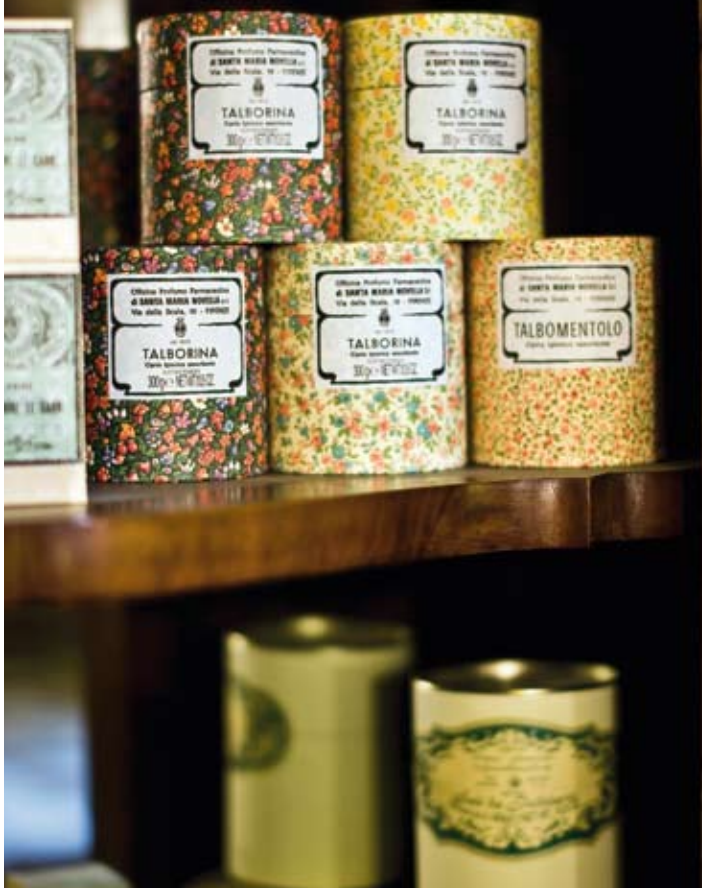
I hyllorna samsas vackra burkar med talkpuder och badsalt.