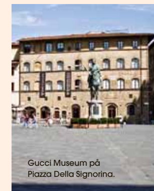
Gucci Museum på Piazza Della Signorina.

För det här är inte första gången Florens modeelit chockerar. Historierna är många. Som när Aldo Gucci lät bygga ett nytt stort tjustat huvudkontor för Gucci utanför Florens på 1970-talet. Byggnaden var höjden av modernitet i marmor och rökfärgat glas. Tjocka heltäckningsmattor och dyra träarbeten. Men det mest uppseendeväckande var de hundratals glasdörrar som alla öppnades och stängdes ljudlöst med hjälp av tryckluft och fotoceller, bara för att Aldo led av fruktansvärd bacillskräck, inget fick vidröras. Huvud-